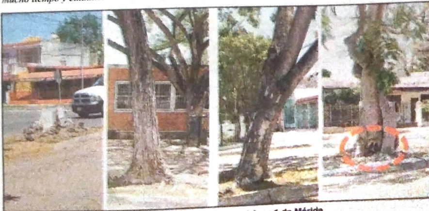
Arbolado urbano en riesgo en el Área 1 de Mérida.

La polémica que se desató respecto al árbol talado en la avenida Remigio Aguilar de la colonia Alemán, nos servirá para analizar en una primera parte la realidad del arbolado urbano en los espacios públicos y, en una segunda, sobre los riesgos y desafíos a los que se enfrentan los árboles en la propiedad privada. Asimismo, la reciente experiencia del árbol caído nos debe servir para dos cosas principalmente. Primero que nada, nos ha demostrado el nivel de conciencia ambiental que la ciudadanía tiene y que el tema de los árboles urbanos no es sólo algo que se queda como letra muerta en el Reglamento para la Protección y Conservación del Arbolado Urbano de Mérida (08-06-2016) o en la Ley de Conservación y Desarrollo del Arbolado Urbano del Estado de Yucatán (10-05-