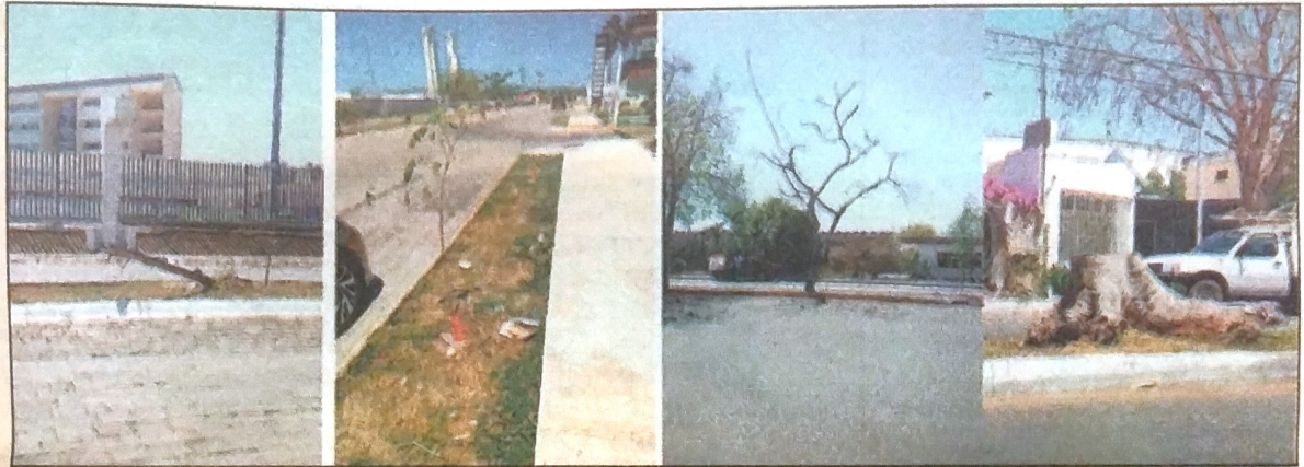
Riesgos del arbolado urbano en el Área 2 de Mérida.

fermedad o porque daña las infraestructuras urbanas. En el Área 2, la masa arbórea de las vialidades no compite con las emblemáticas avenidas del Área 1. Y el Área 3 debería tener una estrategia de planificación territorial y de movilidad urbana que integre infraestructuras verdes de manera prioritaria. Toda vez que lo que hemos perdido en la colonia Alemán, o en lo que sería en el Área 1, no es sólo un árbol, sino lo que en realidad hemos perdido es el tiempo de vida que le llevó a ese árbol ofrecernos su belleza, sombra y servicios ambientales. Por lo tanto, ¿cómo se resarce el daño ambiental que nos deja un árbol caído? Con tiempo, con mucho tiempo y cuidado.