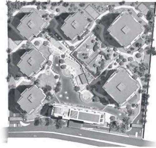
Figura 6 Plan maestro del proyecto Infiniti