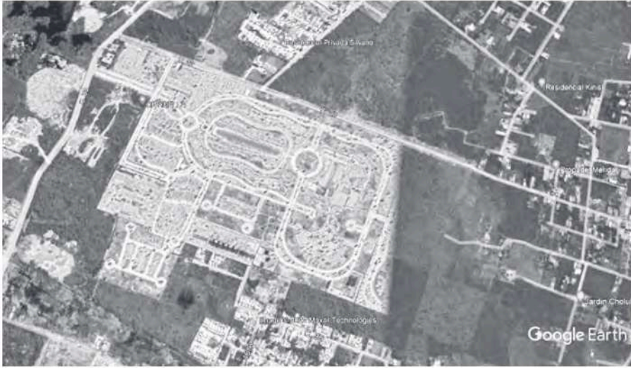
Figura 11 Cittadela