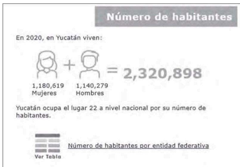
Figura 1 Datos poblacionales en Yucatán