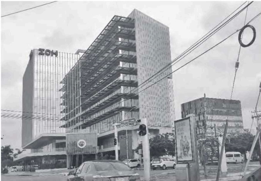
Figura 4 Torres Mid Center y Península en Prolongación Paseo Montejo

Fuente: Fotografía de la autora, 26 de mayo de 2022.