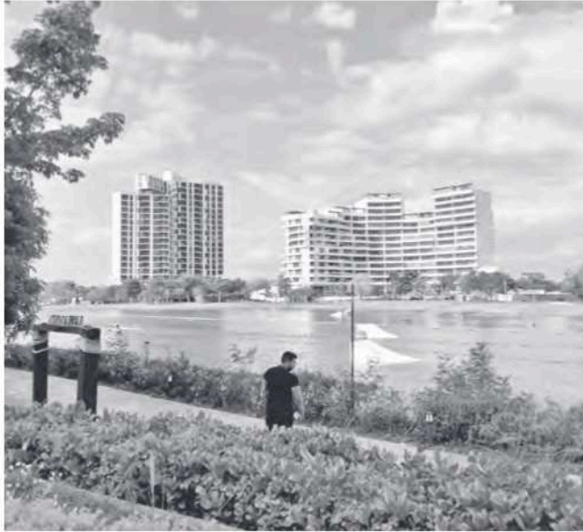
Figura 10 Torres Adamant y Meriden en Cabo Norte desde plaza La Isla