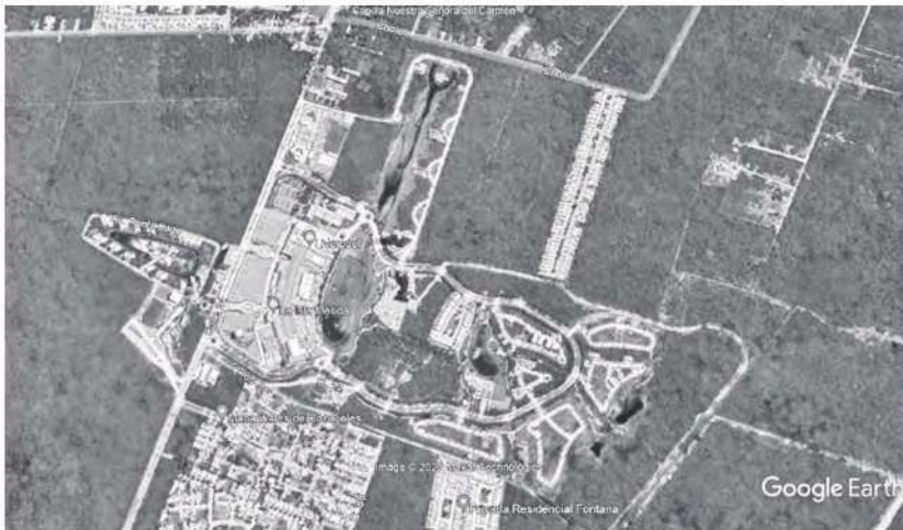
Figura 9 Cabo Norte