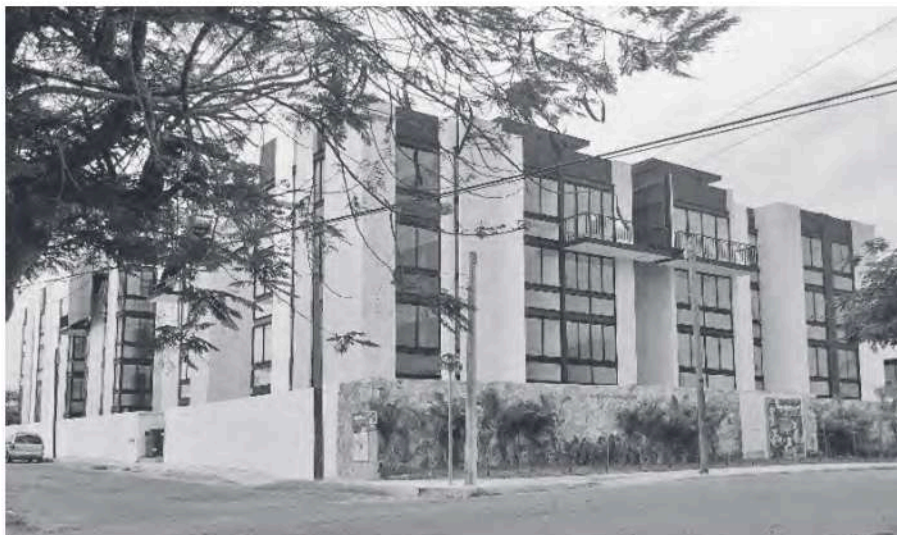
Figura 3 Vista de los departamentos Villas del Sol Signature