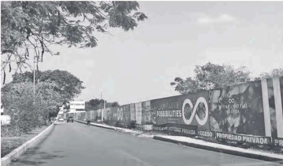
Figura 7 Vista del terreno del proyecto Infiniti “Limitless Living”