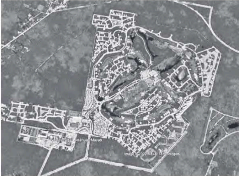
Figura 8 Yucatán Country Club