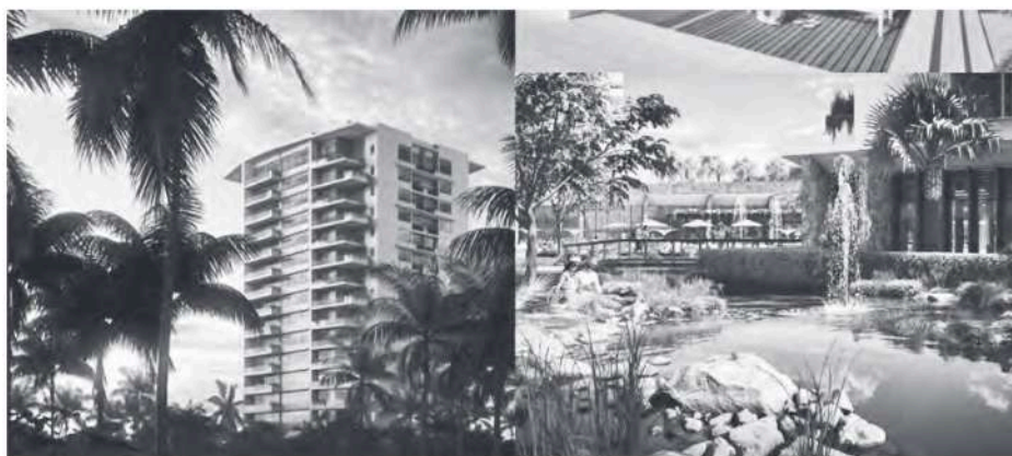
Figura 5 Proyecto Infiniti

En virtud de lo anterior, observamos dos tipos de proyectos inmobiliarios en propiedad de régimen de condominio intraurbanos. Uno está en proceso de conclusión y el otro aún en etapa de proyecto. Si bien lo relevante en ambos casos es la ocupación de predios subutilizados al interior de la ciudad, faltaría