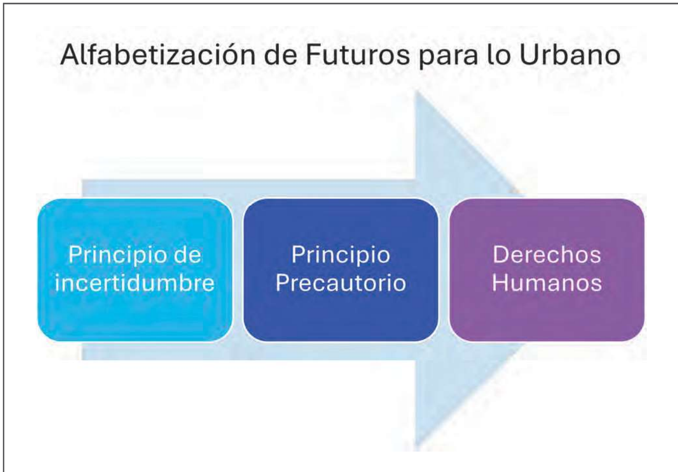
Imagen 1. Alfabetización de futuros para lo urbano.

Ya desde el año 2016, con la cumbre ONU Hábitat III sobre el Derecho a la Ciudad, se establecía la urgencia de comprender la complejidad urbana desde la perspectiva del individuo, reconociéndolo como el habitante que va a poder tener acceso a los beneficios espaciales que la ciudad contempla en sus procesos de crecimiento, desarrollo y planeación.