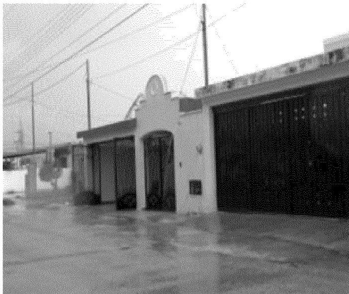
Cuadro 16. Desagüe a la calle en Ciudad Caucel