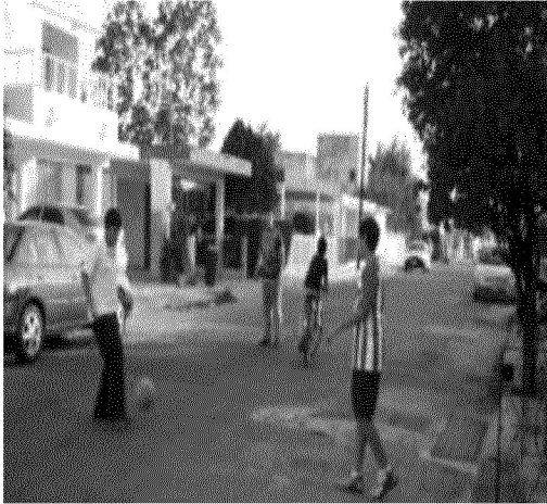
Cuadro 12. Juego Infantil más estacionamiento en la calle de la Colonia Miguel Alemán