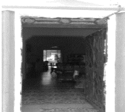
Cuadro 6. Vista desde la calle hacia el interior de la casa. Zona tradicional del Chem Bech en el centro de Mérida