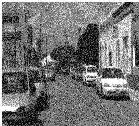
Cuadro 2. Calle del Chem Bech, Zona del Centro Histórico de la ciudad de Mérida