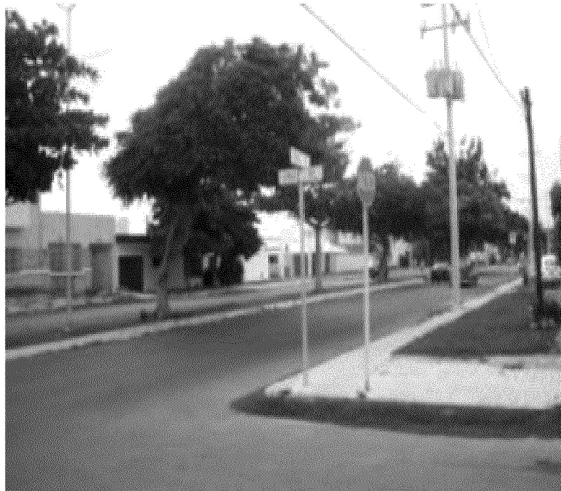
Cuadro 11. Avenida de la colonia Miguel Alemán