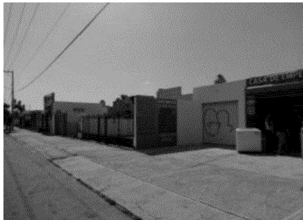
Cuadro 15. Avenida de la Ciudad Caucel en rampa continua sin espacio para estacionamiento en la vía pública