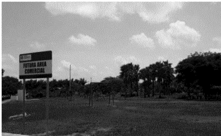
Cuadro 14. Área Verde en Ciudad Caucel anunciada como “Futura área comercial”. Se observa la reducida dimensión de la acera peatonal

La nueva forma de diseño urbano, altamente especulativa que se observa en los mega-fraccionamientos modernos, ha privilegiado el tránsito vehicular y el área vendible, por lo que las escasas áreas verdes en camellones y aceras terminan cediendo su espacio, principalmente, a nuevos arroyos vehiculares. Al interior de los fraccionamientos se privilegia al vehículo, por ello, las calles son para tránsito vehicular y las aceras para acceso a estacionamiento en los predios, así como los nuevos fraccionamientos se han convertido en espacios dormitorio anónimos en los que se abandonan los espacios verdes que se convierten en comerciales y vendibles ante la usencia de uso comunitario (cuadro 14).