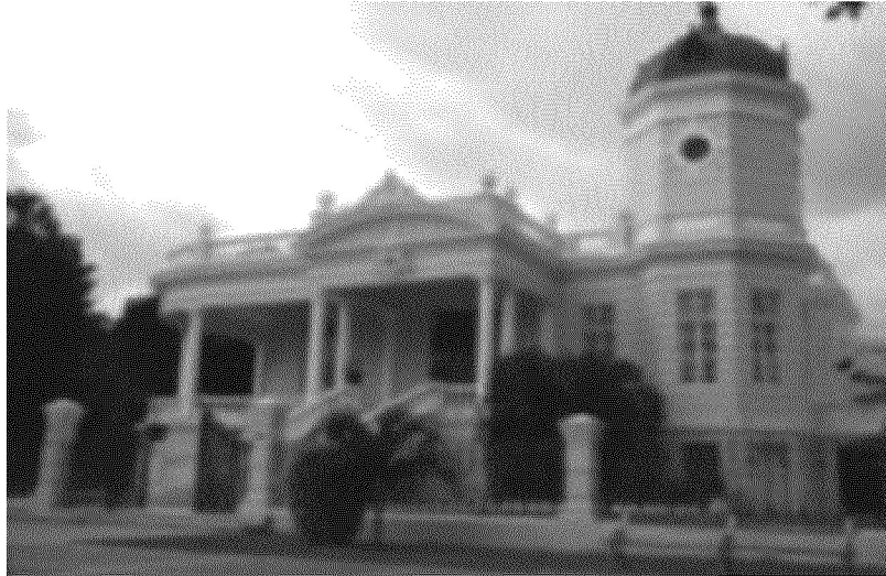
Cuadro 9. Casa Molina en Paseo de Montejo